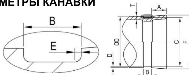
Таблица - А.